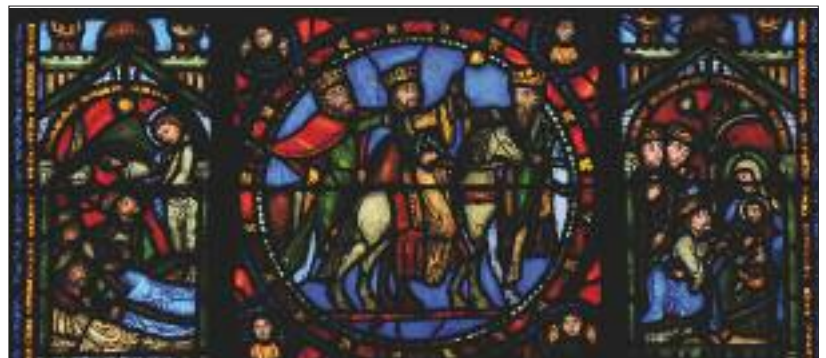
Vitrail de l'enfance du Christ (basilique Saint-Denis) - Les Rois mages Création d'Eugène Viollet-le-Duc et d'Alfred Géroente, 1849